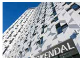
Trondheim 22 mars Scandic Lerkendal scandichotels.no

For informasjon om boende, veibeskrivelse m.m. for de ulike byene, vennligst gå til www.vatour.no og klikk på BESØKENDE > REISE OG OPHOLD