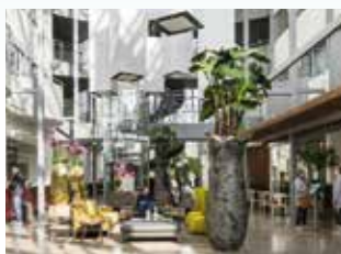
Bergen 15 mars Quality Edvard Grieg nordicchoicehotels.no