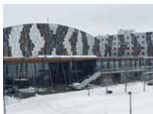
Oslo 20 mars X Meeting Point (tidl. Exporama), Hellerudsletta Xmeetingpoint.no