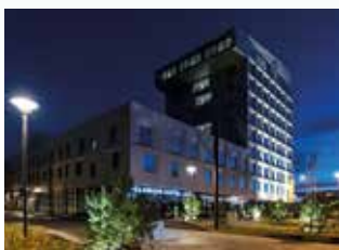
Stavanger 13 mars Clarion Hotel Air nordicchoicehotels.no